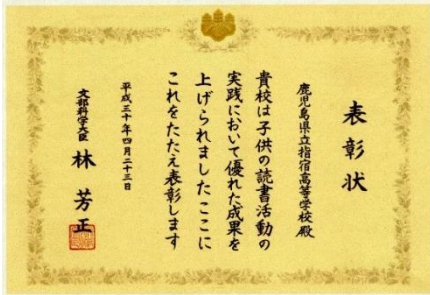
子供の読書活動優秀実践校 絵: KINOKO 字: DONGURI

4月23日の「子ども読書の日」に、子供の読書活動優秀実践校として文部科学大臣表彰を受けました。高校では全国で25校が選ばれ、県内では唯一本校が受賞しました。平成26年度から図書委員を中心に「ビブリオバトル」の取り組みを始め、平成28年には文化祭、平成29年には中学生体験入学でも取り組むことができました。ビブリオバトルの継続的な取り組みや、平成11年から受け継がれている全校一斉の朝読書、ブックデリバリー、図書館だより掲載の四コマ、本と楽しむクリスマスコンサートなどの読書活動が評価されました。これを励みに今後も様々な読書活動に繋がたいです。